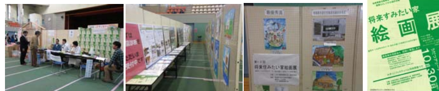
将来住みたい家絵画展での相談会風景とチラシ

来場者は絵画展出展者及びその家族と、同時開催のイベント「みまっこフェスティバル」参加者の約300人となった。