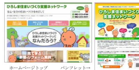
ホームページトップ パンフレット→