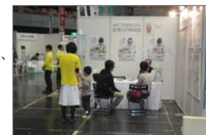
住まいの無料相談会の様子

これらの相談会では、リフォームの予算、業者選び、バリアフリー工事やリフォームの助成金等についての相談などがあつた。このほかにも、土地の活用方法や固定資産税についての質問があつた。建築士や社会福祉士が相談に当たり、アドバイスや関係事業者団体などの紹介を行った。