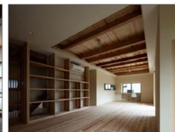
広島県知事賞受賞作品