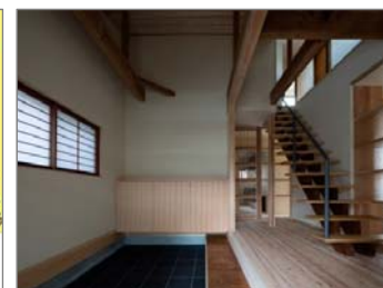
広島県知事賞受賞作品