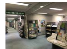
サポートセンターの様子

相談は電話相談が17件、来所相談が4件、訪問相談が1件あった。内容は多岐にわたり、外装工事、床面リフォームなどにおける施工状況の不満、業者との打ち合わせ方法についてのアドバイス、施工業者の紹介依頼、戸建リフォームの相談などについてはアドバイザー派遣を紹介。ほかにリフォーム業者の瑕疵についての相談、見積り適正価格についての相談、補助金の問い合わせなどがあり、関係各所を紹介するとともにアドバイスを行った。また、相談内容によっては専門機関や弁護士を紹介するなどした。