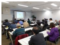
消費者向け講習会

消費者向け「住宅リフォームセミナー」を平成28年10月16日に神戸市（ハウジングデザインセンター神戸）にて開催した。参加者11名。住宅リフォームの進め方、減税制度、さらに「神戸でリフォーム・リノベーション！」と銘打って講習会を開催した。広報は、協議会参加団体を通じての周知と、「兵庫・神戸 みんなの住まい展」HP、兵庫県記者発表、メールマガジン等での周知を行った。