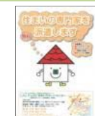
専門家を派遣します

リフォームアドバイザー派遣制度の案内として、紹介するパンフレット「住まいの専門家を派遣します」を配布し、ホームページ、各種セミナー会場、地域の各窓口などで、情報を提供した。また、協議会のパンフレット「住まいづくりを応援します」などでも派遣制度を紹介し、関係各所で配布した。