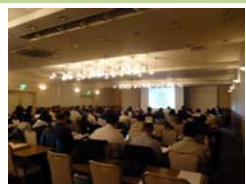
事業者向け講習会

「長寿命化リフォームセミナー」を平成28年11月22日に姫路市（じばさんびる）と、平成28年12月2日に神戸市（パレス神戸）にて開催した。それぞれ、46名と69名の参加者があり、盛況であった。周知は関係団体に案内を通知するとともに、兵庫県住宅改修業者登録制度の登録者にFAXをした。