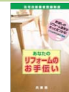
リフォームのお手伝い

(URL http://support.hyogo-jkc.or.jp/support/reform/index.html )