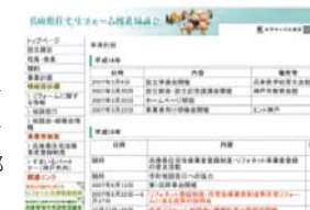
住まいづくりを応援します

消費者に向けた住宅耐震化啓発パンフレット「木造住宅の耐震リフォーム（兵庫県版）」を3,500部作成、関係各所で配布した。他、リフォーム関係制度リーフレット「住まいづくりを応援します」を25,000部作成、関係各所で配布するなどした。