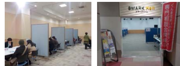
相談会（スマーク伊勢崎会場）