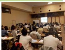
事業者向け講習会

開催案内について、事業者等に案内書を郵送したり、HP に告知を掲載した。また、上毛新聞の「すみかリフォームくらぶ」にも広告を掲載した。