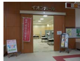
相談会（イオンモール高崎会場）

第 1 回相談会の相談 5 件のうち、リフォームに関するもの 2 件、第 2 回は 9 件中 2 件がリフォームに関連する相談であった。