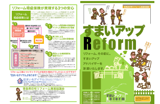
アドバイザー派遣制度のパンフレット

アドバイザーは「契約を前提としない中立的な立場」で住宅の状況、耐震性などに応じた具体的なリフォームのアドバイスなどをするが、事前相談ではクーリングオフの相談なども多く、消費者センターや（公財）住宅リフォーム・紛争処理支援センター等への連携もはかっている。本年度の派遣実績は1件。