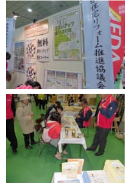
大農林水産祭の様子

県内市町村の住宅リフォーム助成制度情報を収集し、「青森県内のリフォーム助成制度一覧」としてHPなどで公開した。