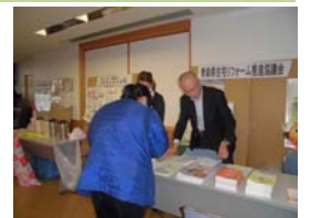
青森県消費者大会の様子

窓口への相談は12月以降2件あり、隣地境界の塀について、及び介護に係る改修の補助金について、関係機関を紹介した。