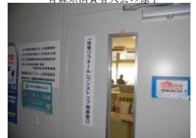
「住宅リフォーム」ワンストップ相談窓口