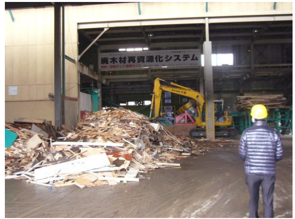
↑ (株)大剛 廃木材の再資源化