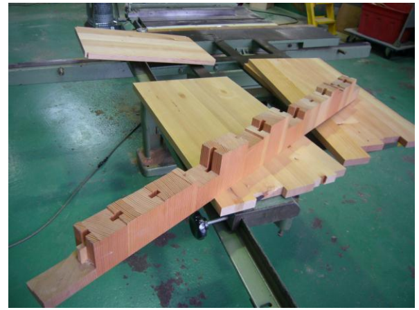
↑ (株)大剛 廃木材の家具等への再利用