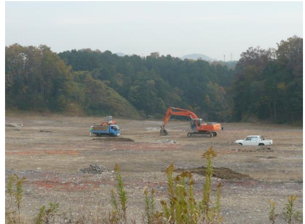
↑ (株)ジェネス 安定型最終処分場