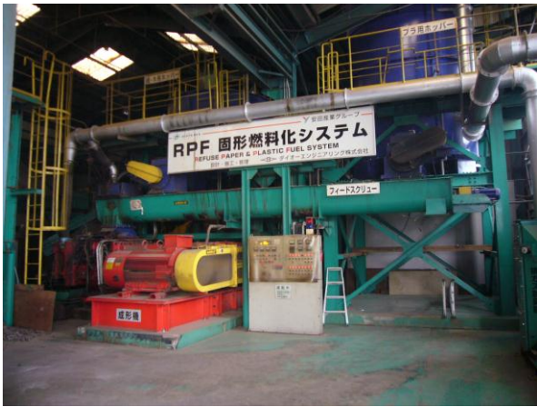
↑ (株)大剛 RPF 固形燃料化システム