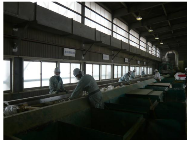
↑ (株)ジェネス 選別ライン