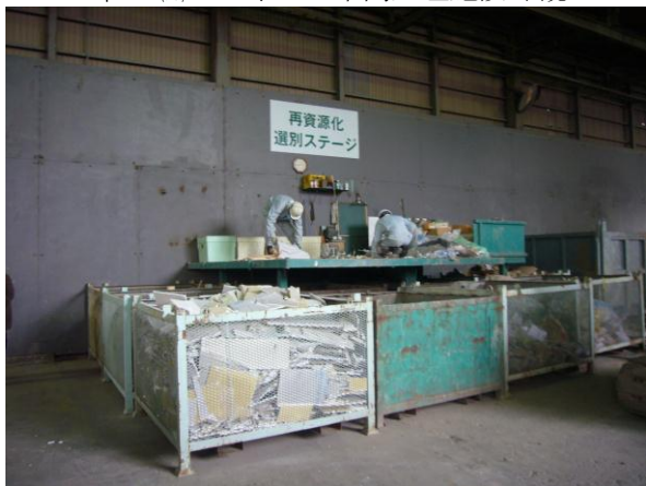
↑ (株)ジェネス 再資源化選別