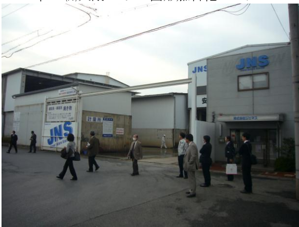
↑ (株)ジェネス 中間処理施設外観